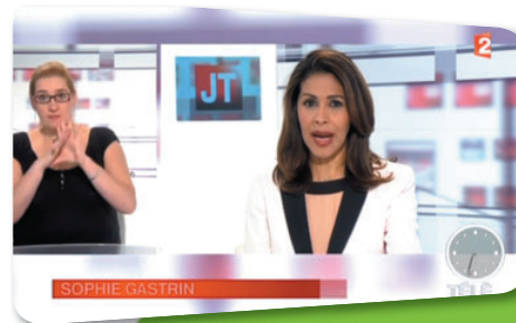
"Télématin" sur France 2