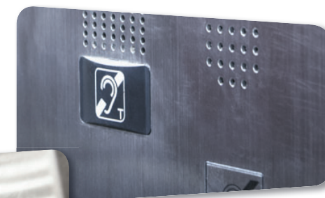
Ascenseurs avec annonce vocale des étages