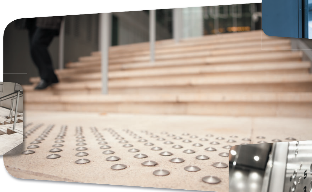
Bandes podotactiles, nez de marche coloré, rampe centrale continue