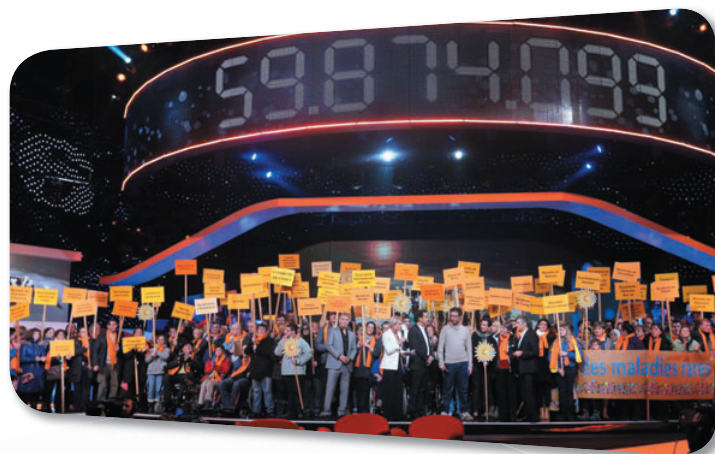
"Téléthon 2012" sur France 2

Nos objectifs sont clairs : s'engager avec efficacité et montrer l'exemple.