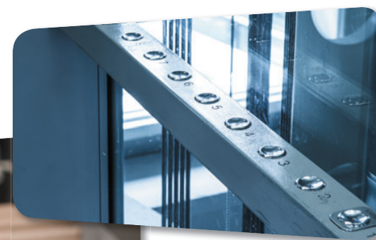
Ascenseurs avec boutons accessibles