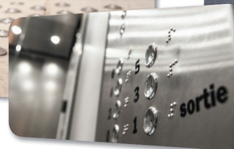
Ascenseurs avec boutons accessibles et en braille