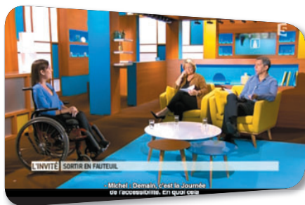
"Le magazine de la santé" sur France 5

Un code couleur permet par ailleurs de faciliter l'identification des différents locuteurs, et donc la compréhension du programme par le téléspectateur. Aujourd'hui, le sous-titrage permet à 4 millions de personnes souffrant d'un handicap auditif d'accéder aux programmes nationaux de France Télévisions. L'accès au sous-titrage s'effectue par le biais d'une touche spécifique de la télécommande. L'ensemble des réseaux de distribution (TNT, câble, satellite, adsl) doivent le proposer.