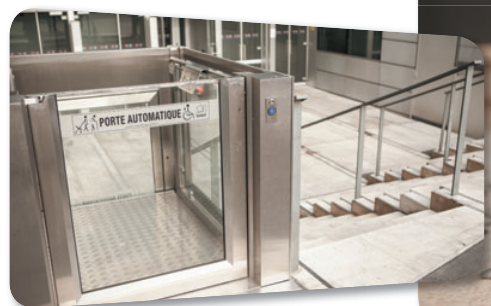
Élévateur dédié aux personnes à mobilité réduite

En cas d'inaptitude, des formations de reconversion sur des postes identifiés peuvent être mises en place.