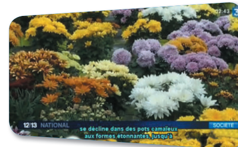
"12/13 National" sur France 3

France Télévisions est aujourd'hui un acteur majeur du développement de l'audio-description à la télévision en proposant un programme audio-décrit en moyenne par jour en 2013 (et un objectif de deux par jour en 2015, contre un par semaine en 2011).